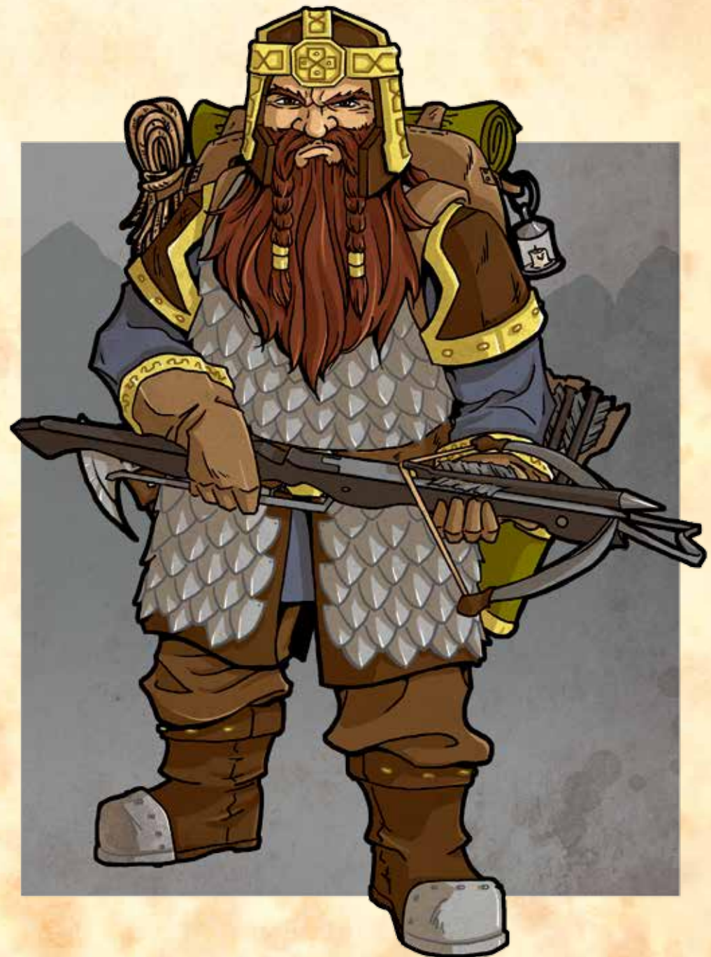
Die Insel der Piranha-Menschen

Heiltrank: Ein Heiltrank darf einmal eingesetzt werden, um einem beliebigen Helden alle verlorenen Ausdauerpunkte zurückzugeben, danach ist er verbraucht. Ein bewusstloser Held ist dadurch augenblicklich wieder einsatzfähig. Den Heiltrank während eines Kampfes einzusetzen, erfordert eine Handlung. Der Heiltrank kann von einem beliebigen Helden verabreicht werden, aber nur wenn der Besitzer des Heiltranks seine Erlaubnis dazu gibt.