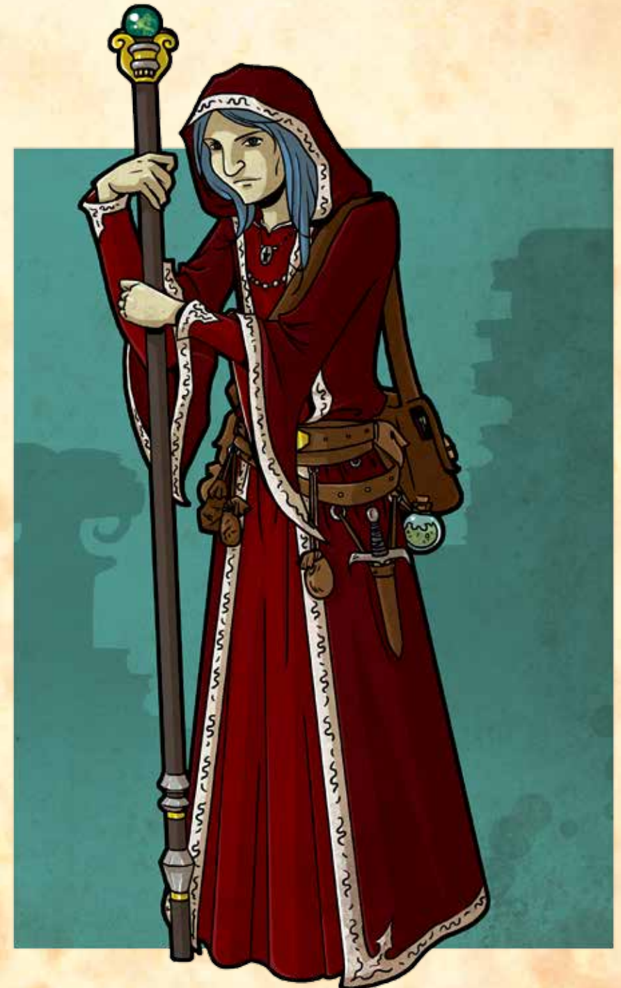
Insel der Piranha-Menschen

Heiltrank: Ein Heiltrank darf einmal eingesetzt werden, um einem beliebigen Helden alle verlorenen Ausdauerpunkte zurückzugeben, danach ist er verbraucht. Ein bewusstloser Held ist dadurch augenblicklich wieder einsatzfähig. Den Heiltrank während eines Kampfes einzusetzen, erfordert eine Handlung. Der Heiltrank kann von einem beliebigen Helden verabreicht werden, aber nur wenn der Besitzer des Heiltranks seine Erlaubnis dazu gibt.