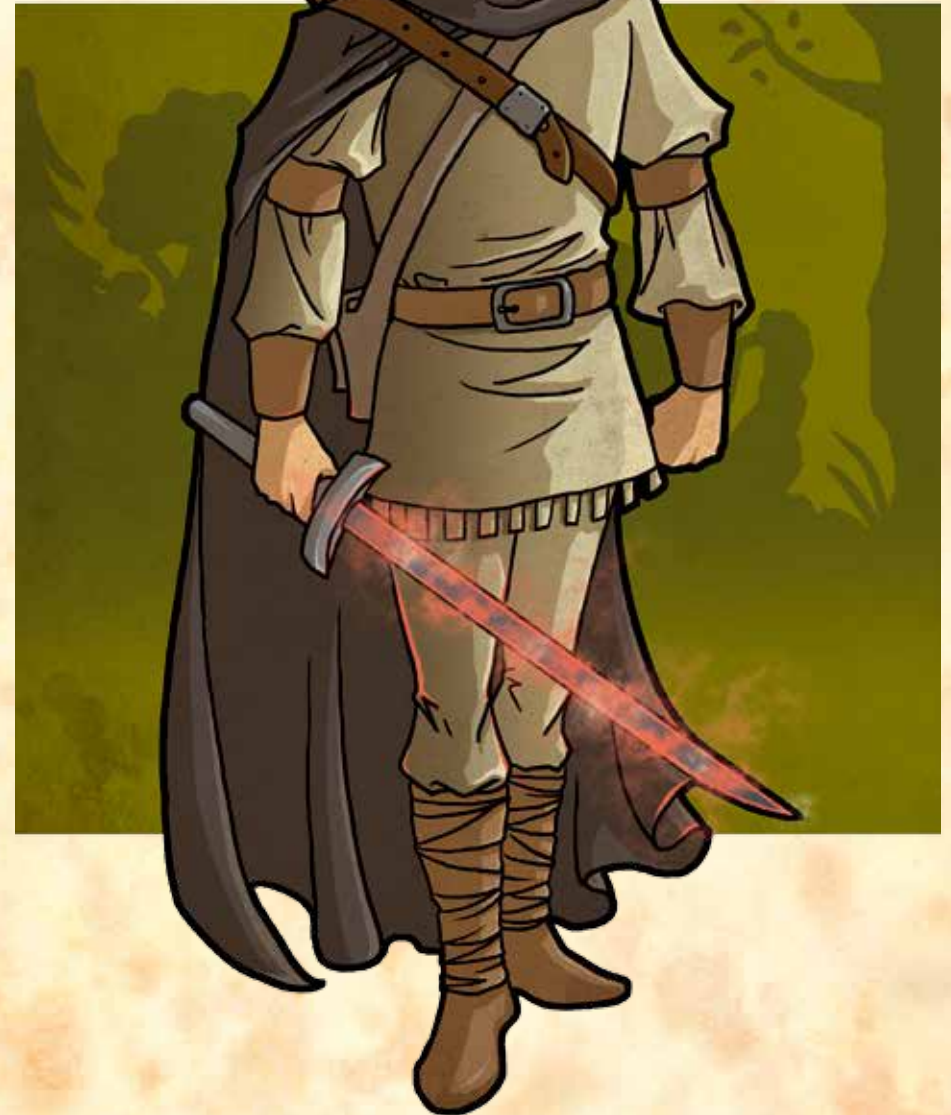
Die Insel der Piranha-Menschen

Heiltrank: Ein Heiltrank darf einmal eingesetzt werden, um einem beliebigen Helden alle verlorenen Ausdauerpunkte zurückzugeben, danach ist er verbraucht. Ein bewusstloser Held ist dadurch augenblicklich wieder einsatzfähig. Den Heiltrank während eines Kampfes einzusetzen, erfordert eine Handlung. Der Heiltrank kann von einem beliebigen Helden verabreicht werden, aber nur wenn der Besitzer des Heiltranks seine Erlaubnis dazu gibt.