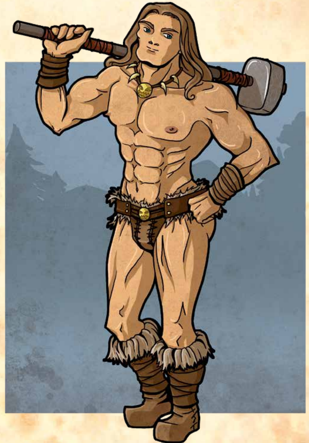
Die Insel der Piranha-Menschen

Heiltrank: Ein Heiltrank darf einmal eingesetzt werden, um einem beliebigen Helden alle verlorenen Ausdauerpunkte zurückzugeben, danach ist er verbraucht. Ein bewusstloser Held ist dadurch augenblicklich wieder einsatzfähig. Den Heiltrank während eines Kampfes einzusetzen, erfordert eine Handlung. Der Heiltrank kann von einem beliebigen Helden verabreicht werden, aber nur wenn der Besitzer des Heiltranks seine Erlaubnis dazu gibt.