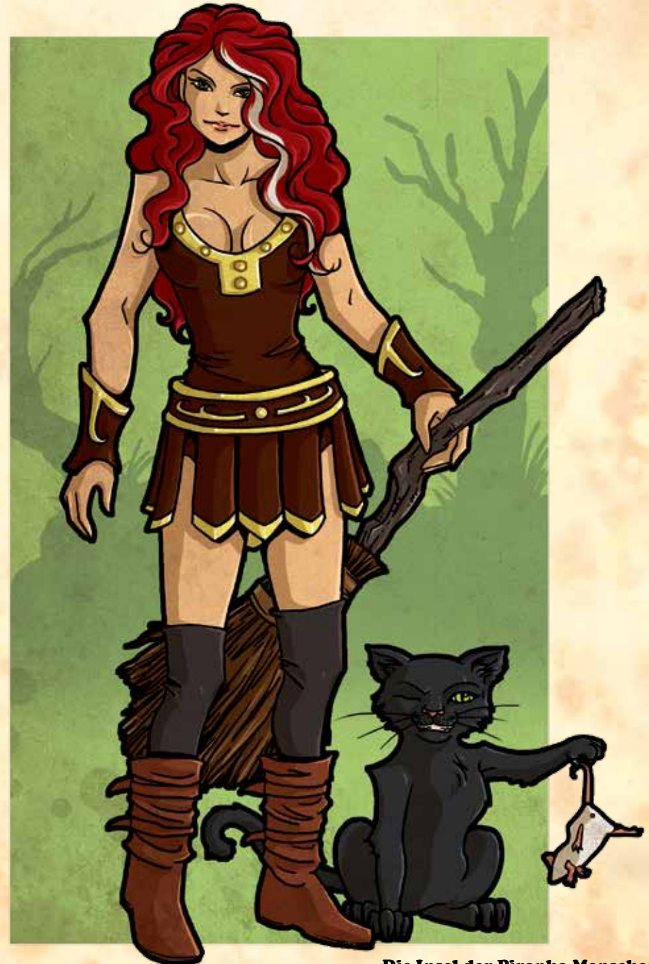
Die Insel der Piranha-Menschen

Heiltrank: Ein Heiltrank darf einmal eingesetzt werden, um einem beliebigen Helden alle verlorenen Ausdauerpunkte zurückzugeben, danach ist er verbraucht. Ein bewusstloser Held ist dadurch augenblicklich wieder einsatzfähig. Den Heiltrank während eines Kampfes einzusetzen, erfordert eine Handlung. Der Heiltrank kann von einem beliebigen Helden verabreicht werden, aber nur wenn der Besitzer des Heiltranks seine Erlaubnis dazu gibt.